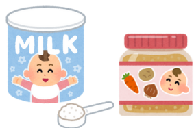
粉ミルク・離乳食