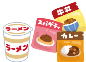
インスタント食品 レトルト食品