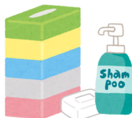
日用品 (ティッシュ、洗剤など)