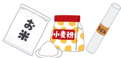
お米・小麦粉・乾麺