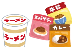
インスタント食品 レトルト食品