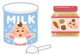
粉ミルク・離乳食