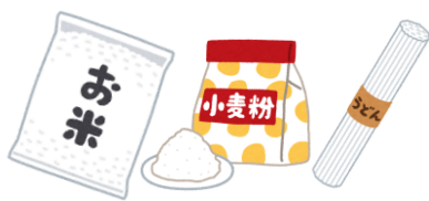
お米・小麦粉・乾麺