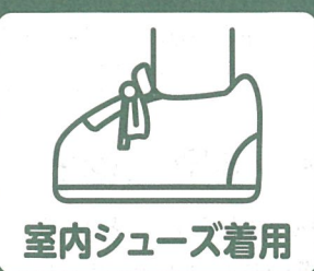
室内シューズ着用