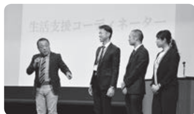
地域支え合いフォーラム

高齢者等の地域生活を支えるため、市内でたすけあい活動を行う団体と連携・協働して生活支援サービスの充実を図るとともに、地域における支え合いの体制づくりを進めます。