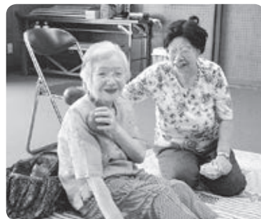
楽しくサロン活動

ふれあいサロン活動に対して助成し、身近な場所での高齢者等が気軽に集い交流や健康づくりなどができる場を設け、介護予防や社会参加を促進します。