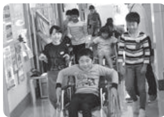
車いす体験学習プログラム

学校や企業の職場研修、地域の集まりなどに職員を派遣し福祉出前講座を行います。また、福祉学習プログラムへの助言や用具の貸出などをを行います。