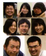
2分間トーク (自由参加)